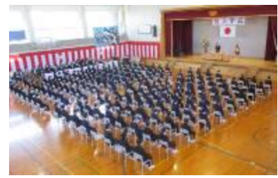
ようこそ東新潟中へ

「東新中ブログ」として、東新潟中生徒の活躍を紹介していきたいと思っております。こちらでもチェックしてみてください。週1回程度の更新を予定しています。