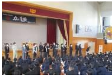
職員紹介の盛り上がり