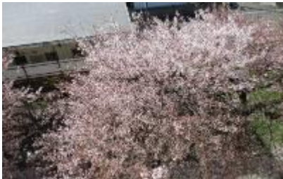
入学式まで持ちこたえた桜